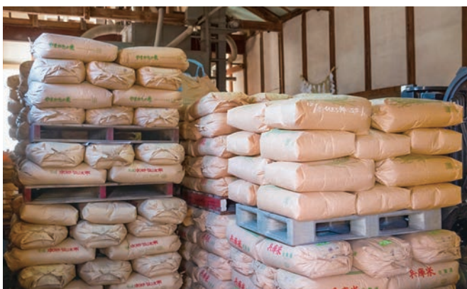
こだわりの「特A地区」東条地区産の山田錦

そこで、農家の方々と交流を深めることから始めました。毎年、飛行機で大阪に飛び、伊丹空港からレンタカーで現地に向かい、田植えや稲刈りの時期には一緒に作業して汗を流しました。その結果、地元の農協や農家の皆さまと信頼関係を築くことができ、今では東条地区の山田錦を分けていただけるようになりました。